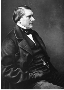
Labiche photographé par Nadar © droits réservés