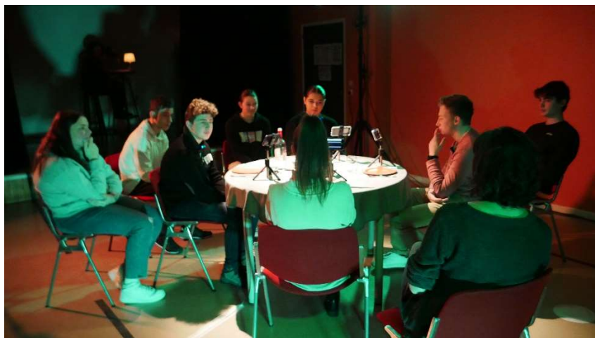
Laboratoire au Lycée de Bitche : test à 12 joueurs, mars 2023.